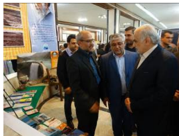
بازدید استاندار و مدیرکل پدافند غیر عامل