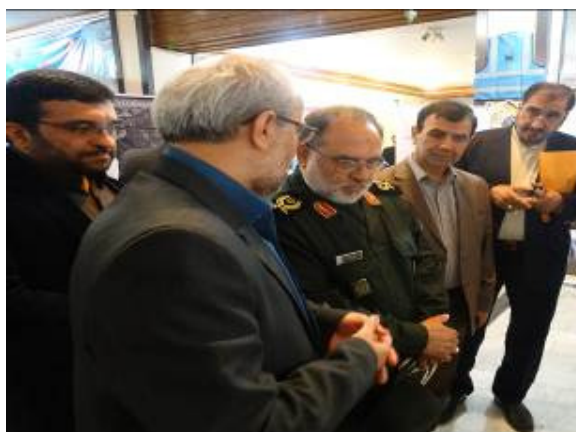
حضور سردار بابایی فرمانده سپاه کربلا مازندران